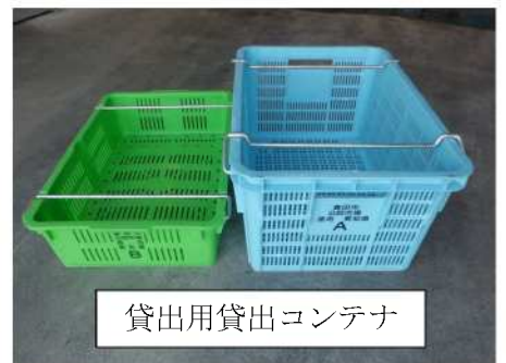
貸出用貸出コンテナ

豊田市公設地方卸売市場は、水産、青果卸売、関連店舗を持つ公設の総合卸売市場です。 野菜・果物の卸売を行う青果卸売業者は2社あり、せりをはじめとした取引で地元スーパー や小売店、飲食店等に野菜・果物の販売をしています。